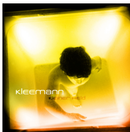
„Kleiner Held“ (2002)